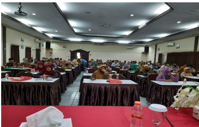
Gambar 2 Seminar Bimbingan Teknis Dinas Pendidikan Kabupaten Bogor

Menurut temuan media yang didapatkan oleh peneliti bahwa yaitu Dinas mengadakan seminar pendidikan inklusif untuk tenaga pendidikan yang satuan pendidikannya ditetapkan sebagai sekolah inklusif. Kegiatan seminar dilaksanakan tahun anggaran 2019-2023 dengan total tenaga pendidik yang mengikuti work sebanyak 711 tenaga pendidik SD dan 593 tenaga pendidik SMP. Guru-guru yang dilatih sebanyak 2 orang serta diberikan pelatihan dalam pelaksanaan pembelajaran pendidikan inklusif, menangani ABK, dan penilaian. Jadi dinas pendidikan mengatisipasi guru pendamping khusus dengan melatih guru-guru sekolah untuk mendampingi ABK.